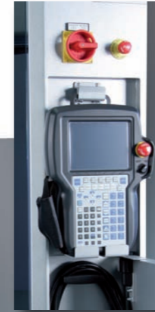
Mobiles Touch Panel mit integriertem Not-Aus-Schalter und Kabelfach

Das herausragende Produktdesign der neuen HandlingTech ROBAX-Zelle setzt innovative Maßstäbe im Bereich der Automatisierung. Die klare Formensprache des Rahmens definiert das Erscheinungsbild der Zelle völlig neu und bietet überzeugende funktionale und ergonomische Vorteile.