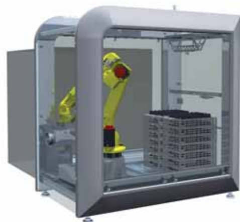
Palletmaster für Transportwägen