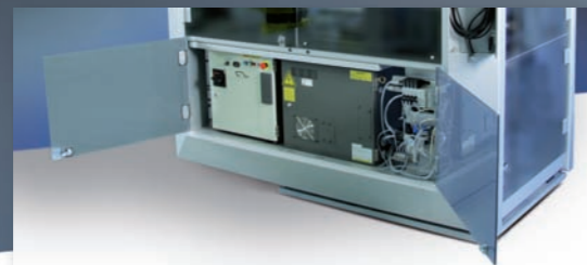
Teilweise integrierte Steuerung

Zahlreiche wirtschaftliche und technische Vorteile der Zelle sind die Grundlage für das unverwechselbare Design des Rahmens und nicht umgekehrt - Form follows function.